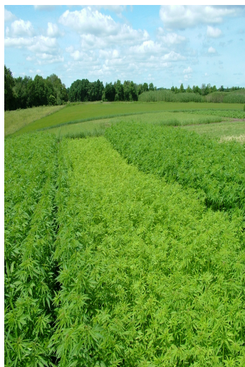
Foto 2. Demo-parcel i Foulum d. 15. juni 2011. Begge underparceller er behandlet ens, dog har den forreste ikke fået nogen form for ukrudtsbehandling. Ukrudtet har taget sin del af kvælstoffet i jorden.

Når man ser på den samlede tørstofproduktion blev der på målt størst produktion på 14-16 ton tørstof pr. ha i den konventionelle behandling. Da den konventionelle hamp ikke er sprøjtet med pesticider, skyldes denne forskel sandsynligvis en højere tilførsel af kvælstof. Altså umiddelbart en lidt bedre sammenhæng mellem tørstof produktion og tilførsel af gødning end mellem frøproduktion og gødsning.