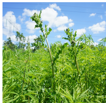
Foto 3. En svag hampafgrøde kan ikke holde tidslerne nede, heller ikke på Foulum.